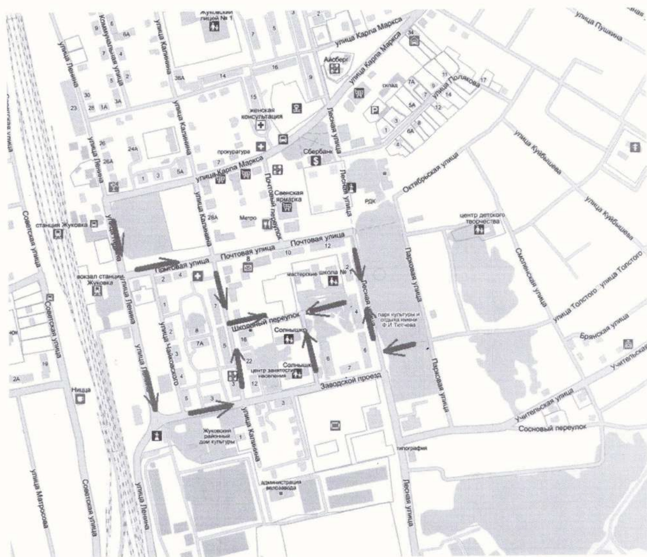
Схема безопасности маршрута в МАДОУ детский сад «Солнышко»